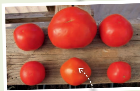
Tomaten OHNE Nährhumus: