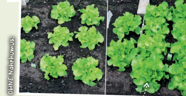
Salat nach 4 Wochen MIT Nährhumus: