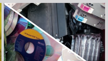
CD/DVD & Tonerkartuschen