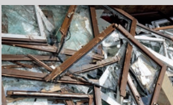
Fenster mit Glas