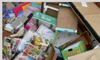
Papier und Kartonage